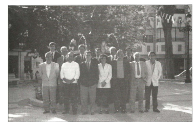
CANDIDATURA DEL P.S.O.E.

ORGANO INTERNO DE DIFUSION DE LA COMUNIDAD MUNICIPAL DE CULTURA DOÑA MENCIA (CORDOBA) - JUNIO - 91 - AÑO XII - NUM. 139