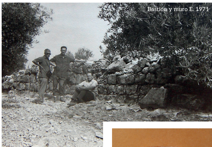
Bastión y muro E. 1971