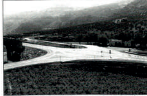
Se inauguró el tramo de la nueva carretera que pasa por la Estación con lo que la infraestructura vial de la zona mejora considerablemente. Información en la página 5