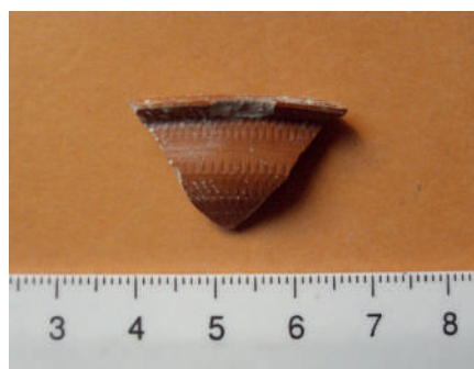
T.S. Clara, A borde dec. fin.s.I-med.III d.C.