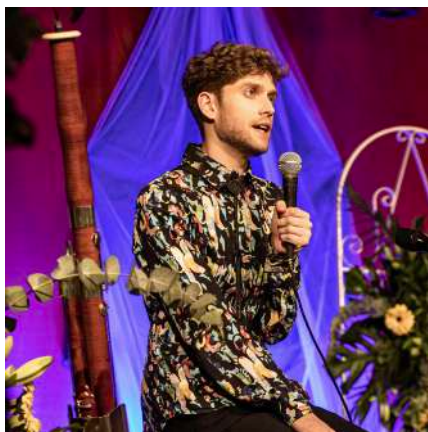
Fotografía del espectáculo ÍTTANTÉ en el Auditorio Iglesia Vieja, Doña Mencía

En 2015 prosiguió con su formación en el Conservatorio Superior de Música de Navarra. Poco tiempo después entraría en una crisis emocional, aunque continúa con su actividad musical como hasta entonces. “Llega un día que toco por casualidad con un guitarrista flamenco, con Enrique Ordoñez. Jamás se me va a olvidar esa sensación en la que el bello se me puso de punta, en el Pósito municipal. En ese instante fue cuan-