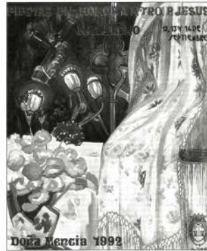
CARTEL ANUNCIADOR DE LAS FIESTAS EN HONOR DE JESUS NAZARENO ES OBRA DEL ARTISTA LOCAL FRANCISCO JIMENEZ PRIEGO

ORGANO INTERNO DE DIFUSION DE LA COMISION MUNICIPAL DE CULTURA DOÑA MENCIA (CORDOBA) - SEPTIEMBRE - 92 AÑO XIII - NÚM 154