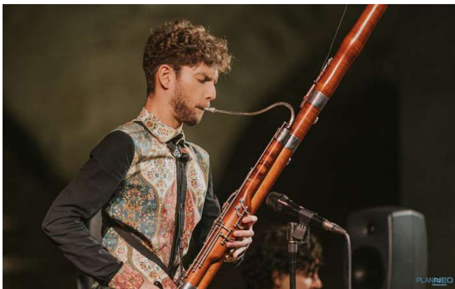
Fotografía del espectáculo ÍTTANTÉ junto a la Calahorra, Córdoba

Comencemos por el principio, ¿por qué el fagot? “En mi familia, aunque nadie se ha dedicado a tocar ningún instrumento, sabes que siempre ha tenido interés por la cultura. A todos mis abuelos, tanto paternos como maternos, les ha gustado mucho la música, incluso los cuatro han estado en la coral. Un día mi madre me preguntó si quería matricularme en el Conservatorio de Lucena. Y la verdad no sé por qué. Yo tenía entonces nueve años y tampoco es