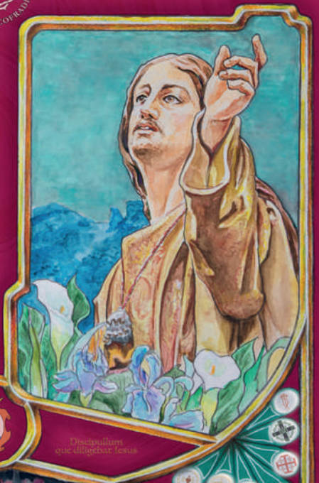
Discipulum que diligebat Iesus